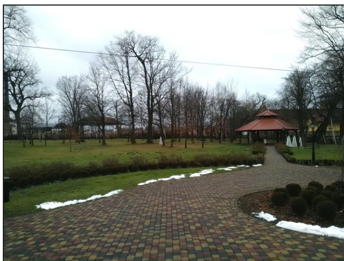
Pozostałości parku przy dworze „Belweder” w Chmielowie

Wokół dworu rozciąga się park o układzie swobodnym, założony w I. poł. XIX w. Do dworu prowadziła aleja dojazdowa, której zakończenia znajdowały się po pn.-wsch. i pd.-zach. granicy. Przed frontem dworu znajdował się kolisty klomb z podjazdem. W parku występowały grupy drzew i krzewów, które w części pn.-zach. zgrupowane były w dwóch skupieniach. Nielicznie naniesione ścieżki w tej części parku miały układ swobodny. Znajdowało się tu również niewielkie zagłębienie wypełnione wodą, która odpływała w kierunku północnym. Część rolniczo-ogrodnicza przylegała do parku od strony pn. i zach. Miała ona zwłaszcza w części pd.-zach. regularny kwaterowy charakter z siecią prostopadle krzyżujących się ścieżek wzdłuż których rosły krzewy.