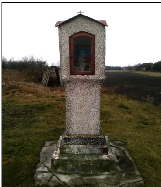
Kapliczka murowana z figurą Matki Bożej Niepokalanej w Cyganach

Niewiele zachowało się na tym terenie zabytkowych krzyży drewnianych. Są one wykonane z różnych gatunków drzew, często z dębu jako materiału najtrwalszego i posiadają z reguły skromne zdobienia oraz wyryte inskrypcje. Na szczególną uwagę wśród nich zasługuje krzyż z drewnianą, ludową rzeźbą Chrystusa Ukrzyżowanego w Chmielowie, usytuowany przy drodze Tarnobrzeg - Rzeszów.