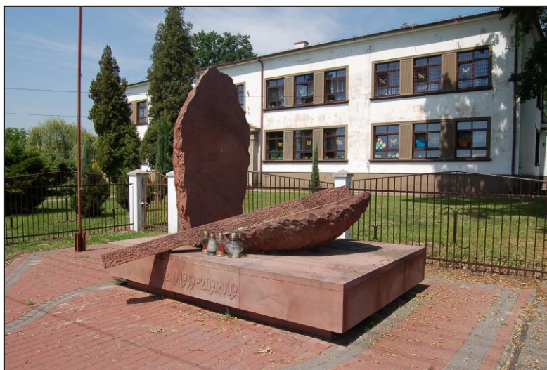
Pomnik ofiar bombardowania w Chmielowie

W roku 2009 został odsłonięty pomnik upamiętniający 70 rocznicę bombardowania Chmielowa, usytuowany w okolicy budynku Szkoły oraz Kościoła. Postument złożony jest z betonowej prostokątnej podstawy obłożonej granitowymi płytami, na której znajduje się motyw leżącego krzyża i stojącego głazu z granitu z napisem „OFIAROM BOMBARDOWANIA”.