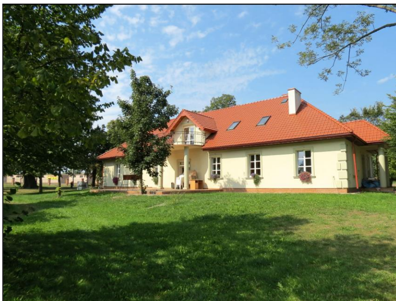
Dwór „Belweder” w Chmielowie

Dwór w Chmielowie zwany "Belwederem", pochodzący z pierwszej poł. XIX w., usytuowany jest w południowo-zachodniej części miejscowości. Wybudowany z cegły palonej, obustronnie otynkowany. Założony na planie wydłużonego prostokąta, dwutraktowy, zwrócony elewacją frontową w kierunku północno-zachodnim. Bryła prostopadłościenna, jednokondygnacyjna, bez podpiwniczenia, nakryta dachem czterospadowym o połaciach dachówkowych.