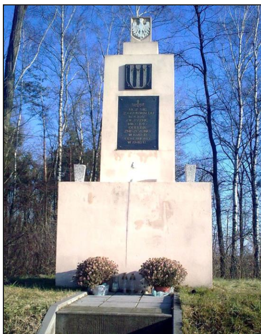
Pomnik grunwaldzki w Chmielowie

Ponownie pomnik został odnowiony w roku 2010 z okazji 600-lecia Bitwy pod Grunwaldem.