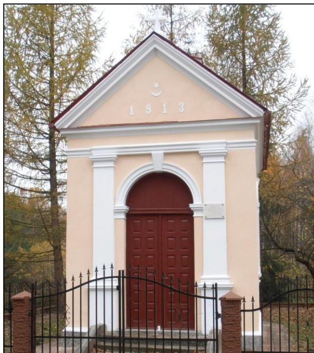
Kapliczka z obrazem św. Rozalii w Rozalinie

Wyróżnikiem jest interesujące opracowanie wejścia, ujętego portalem w postaci półkolistego arkadowego obramienia, flankowanego dwoma pilastrami. W ścianach bocznych okna z dekoracyjnymi obramieniami. Dach dwuspadowy z sygnaturką, w polu trójkątnego frontonu umieszczono herb Tarnowskich - Leliwa oraz datę 1913.