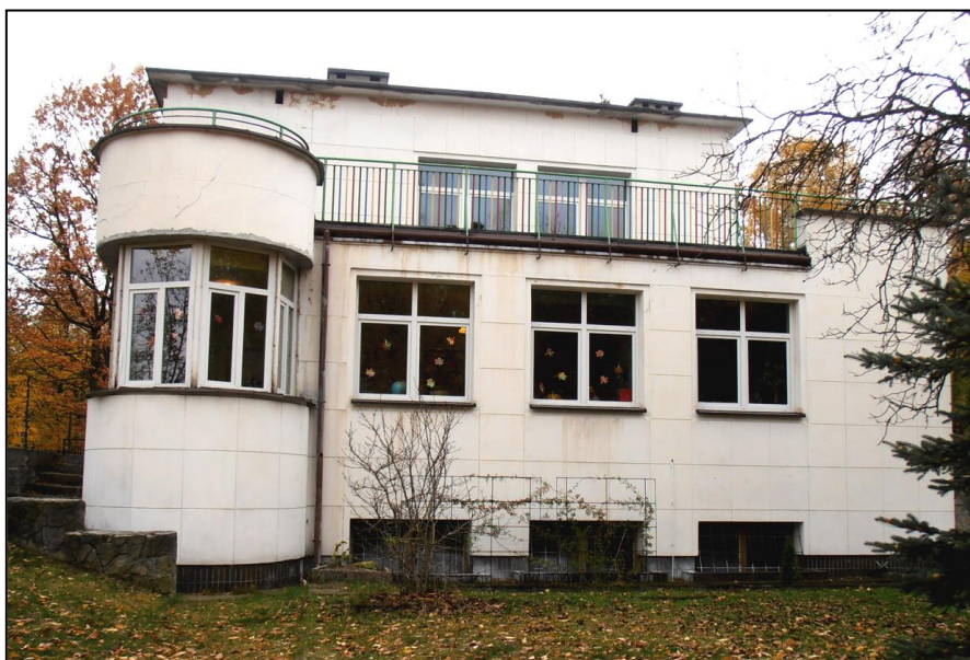
Willa dyrektora wytwórni amunicji nr 3 w Nowej Dębie

Budynki dla kadry kierowniczej i dyrektorskiej charakteryzuje styl architektoniczny art. déco, który cechuje uproszczona forma i geometryczne kształty nawiązujące do tradycji klasycznej. W latach powojennych 1949-1957 na terenie osiedla wybudowano budynki mieszkalne wielorodzinne w stylu socrealistycznym. Powstały 34 budynki mieszkalne w części centralnej o architekturze realizowanej w Polsce w latach 1949-1956 w ramach obowiązującej wówczas doktryny realizmu socjalistycznego, definiowanej w tym czasie jako „socjalistyczna w treści i narodowa w formie”.