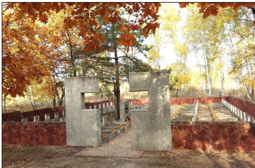
Cmentarz wojenny w Chmielowie

Ponadto, nowe cmentarze założone zostały wraz z powstaniem parafii w Cyganach i Jadachach.