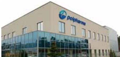
Sanfarm w strukturach...