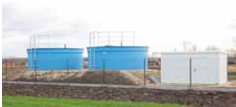
Hydrofarm w Chmielowie...