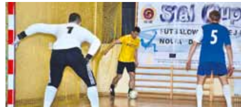
STAL CUP 2013