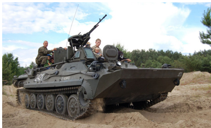
Transporter rozpoznania inżynierskiego saperów z Niska