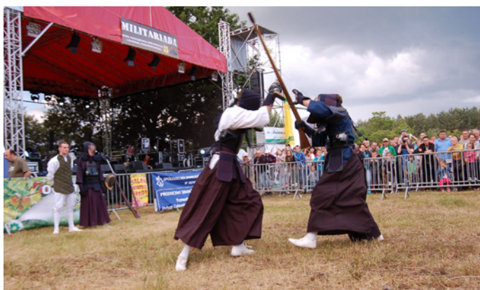
Szermierka samurajów w wykonaniu GRH Okręgu Policji Państwowej z Radomia