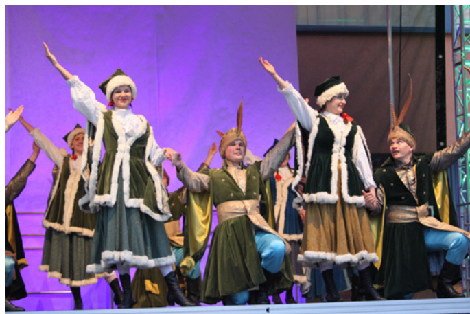
Polonez Mazur w wykonaniu grupy studenckiej ZPiT „DEBIANIE”