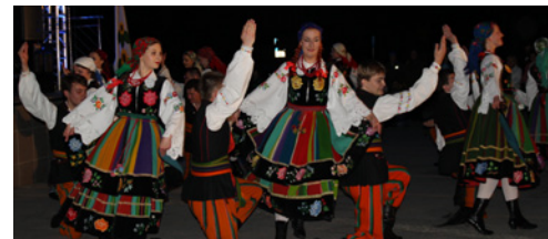
» str. 17 15 lat zespołu DĘBIANIE... » str. 18