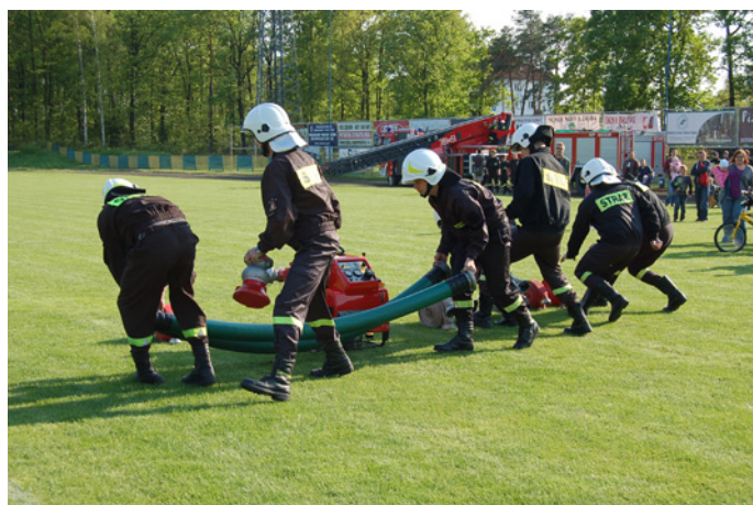
Dzień Strażaka na stadionie SOSiR