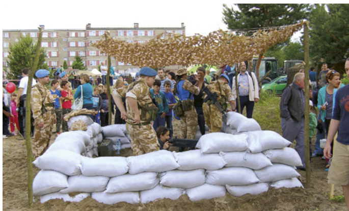
Diorama misji pokojowej ONZ na Cyprze