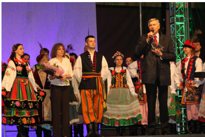
Wręczenie „DEBIANOM” statuetki „Zasłużony dla miasta i gminy Nowa Dęba”