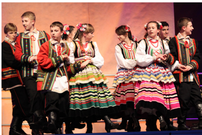
Grupa młodsza „DEBIAN” podczas Suity Tańców Lubelskich