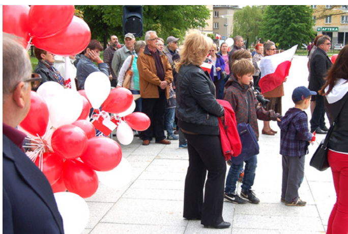
Mieszkańcy placu Gryczmana podczas Świąt Flagi Rzeczypospolitej Polskiej