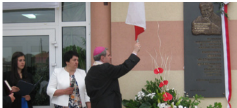
» str. 7 150 lat szkolnictwa w Jadachach