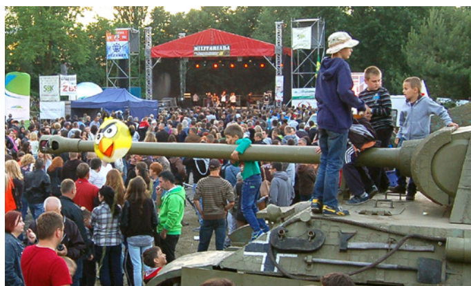
W oczekiwaniu na kolejny koncert ...