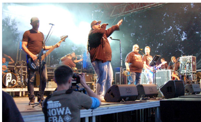
Występ zespołu PIERSI