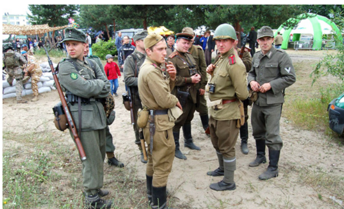
Rekonstruktorzy przed bitwą