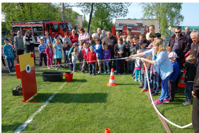
Dzień Strażaka na stadionie SOSiR