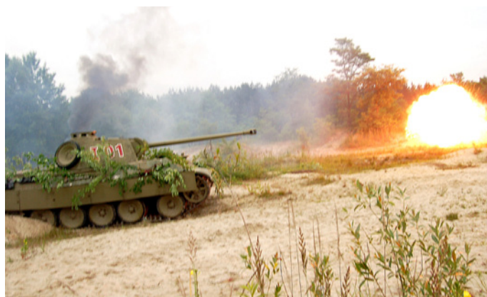
Replika czołgu Panther podczas rekonstrukcji bitwy pancernej