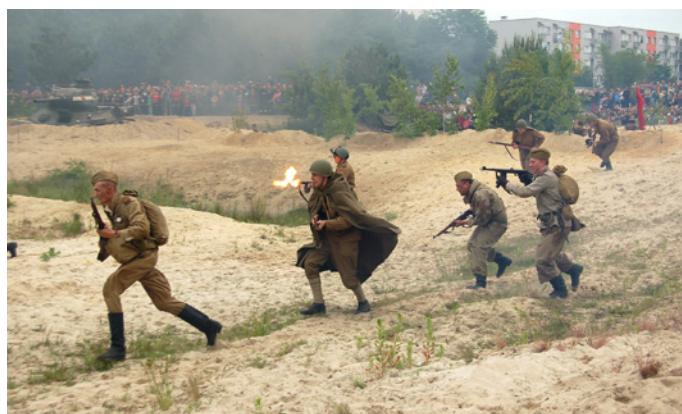
Rekonstrukcja bitwy pod Studziankami