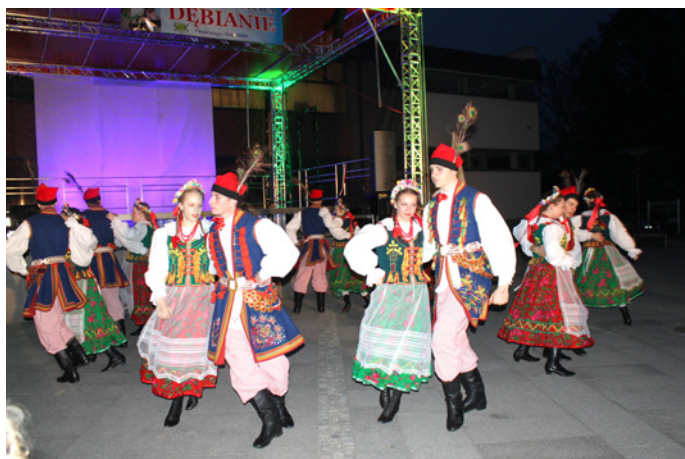
Krakowiak w wykonaniu II grupy „DEBIAN”