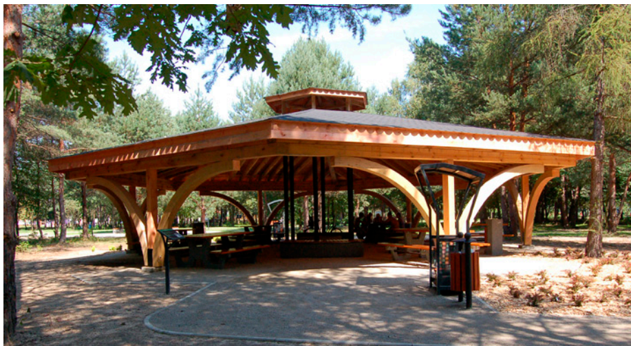
Z dużej wiaty ogniskowej można korzystać bezpłatnie. Grupy zorganizowane obowiązują wcześniejszą rezerwacją w SOSiR

Powierzchnia placu zabaw z nawierzchni bezpiecznej absorbującej ewentualny upadek to 117m 2 . Rodzice będą mogli obserwować swoje pociechy z zamontowanych w pobliżu ławek lub z sąsiadującej z placem mini siłowni. Docelową grupą użytkowników są dzieci w wieku od 3 do 12 lat.