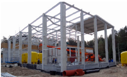
Stacja Uzdatniania Wody - nowa hala w budowie

Jednocześnie Zarząd Przedsiębiorstwa Gospodarki Komunalnej i Mieszkaniowej Sp. z o.o. w Nowej Dębce, w porozumieniu z burmi-