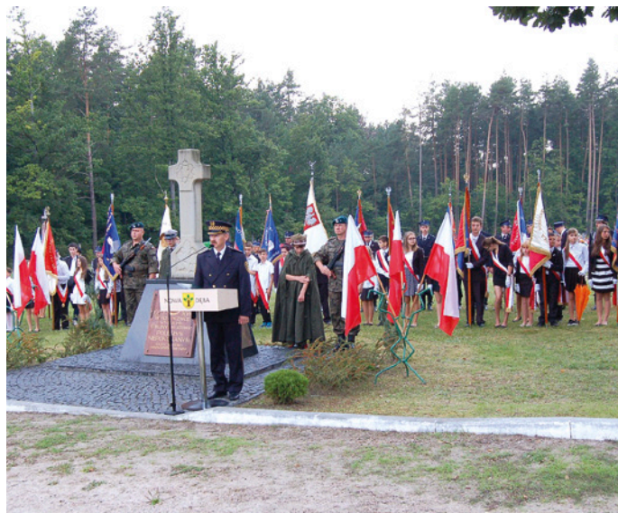
Uroczystości na cmentarzu komunalnym z okazji 75 rocznicy wybuchu II wojny światowej