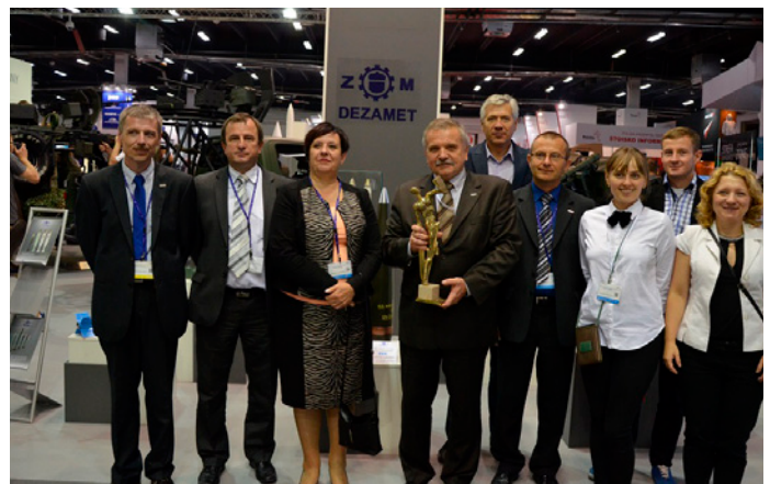
Pamiątkowe zdjęcie z Defenderem przy stoisku DEZAMET-u podczas MSPO 2014 w Kielcach

W ostatnim dniu targów, Dezamet S.A. wspólnie z Wojskowym Instytutem Technicznym Uzbrojenia (WITU) z Zielonki został wyróżniony nagrodą „Defender