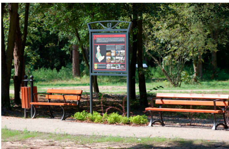
Tablica informacyjna na jednej ze ścieżek edukacyjnych