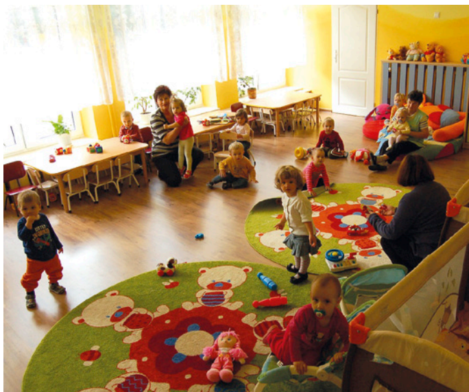
Kolorowa sala dziecięca w Żłobku Miejskim