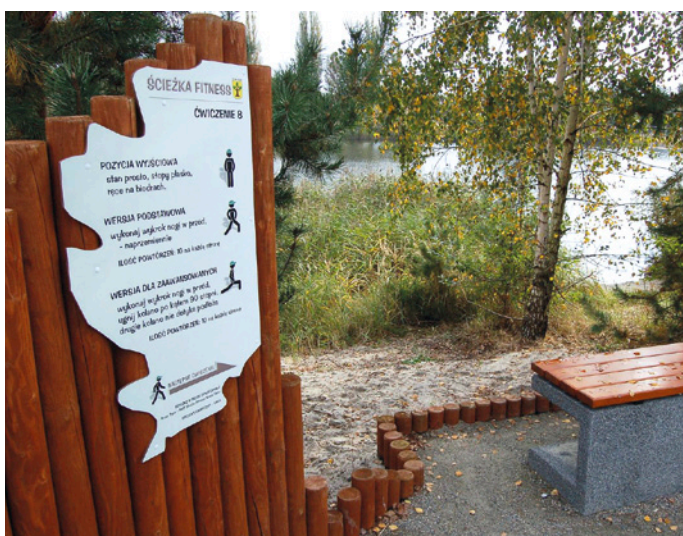
Jeden z przystanków ścieżki fitness wokół Zalewu