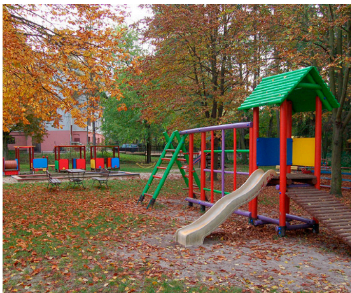
Plac zabaw dla dzieci przy Żłobku Miejskim zyskał nowe urządzenia