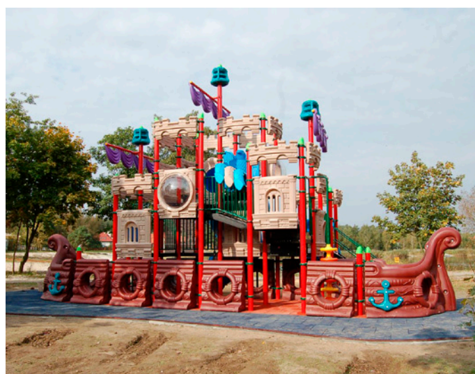
Plac zabaw w kształcie pirackiego statku w całej okazałości