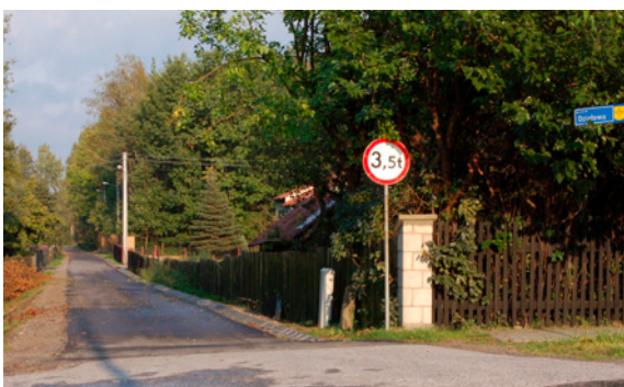
Nowy asfalt na ulicy Działowej

W grudniu 2013 r. doszło do zarwania mostu na rzece Dęba w Alfredówce przez firmę transportującą drewno z lasu. W tej sprawie zwróciliśmy się do ubezpieczyciela firmy transportowej o pokrycie kosztów budowy nowego mostu, gdyż nie było już czego naprawiać. Do chwili obecnej nie udało się osiągnąć porozumienia w tej sprawie, mimo opinii biegłego, że