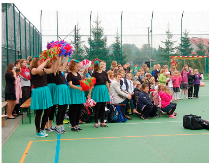
Gorący doping podczas inauguracyjnego meczu koszykówki na boisku w Jadachach