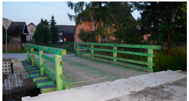
Postawiony na nowo most na rzece Dęba w Alfredówce

niosła ponad 170 tys. zł, gdyż urządzenia odwodniające drogę nie były kwalifikowane do promesy na usuwanie skutków powodzi, gdyż ich w 2010 r. po prostu nie było. Ich wykonanie było niezbędne, aby korpus drogi w tym grząskim terenie nie uległ szybkiej degradacji. Dodać należy, że w dalszej kolejności będziemy odwadniać gruntową część drogi Działowa. Na to zadanie osiedle Poręby Dębskie przekazało ze swojego funduszu 25 tys. zł, przy wartości kosztorysowej zadania wynoszącej 45 tys. zł. Zakończenie tych prac przewidziane jest na początek listopada.