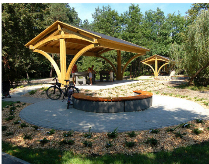
Wiaty tematyczne nad Zalewem