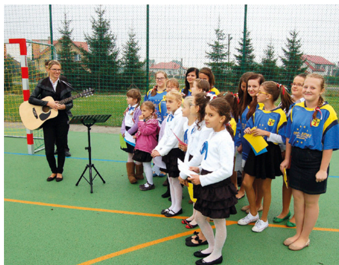
Otwarcie nowego boiska wielofunkcyjnego w Jadachach miało bogatą oprawę