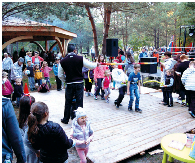
Piknik Pożegnanie lata nad Zalewem