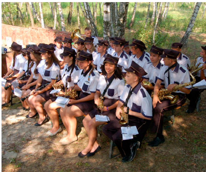
Młodzieżowa Orkiestra Dęta z Chmielowa podczas uroczystości na cmentarzu wojennym