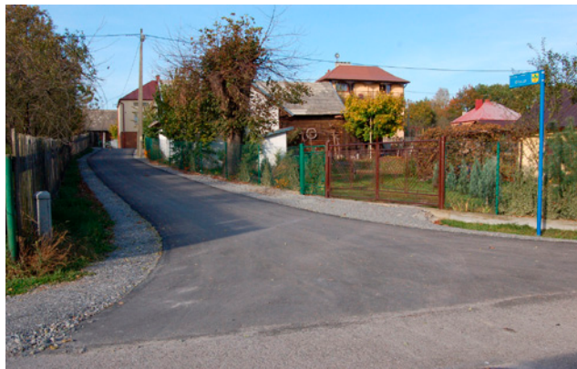
Ulica Krucza teraz asfaltowa

Zgodnie z ustaleniami zebrań wiejskich i osiedlowych z roku ubiegłego, nawierzchnię bitumiczną otrzymały następujące ulice i drogi: w Porebach Dębskich – ulice: Działowa i Długa; w Dębnie – ulice: Zybury, Kręta, Krucza, Sowa, Stawowa, Podgórze (boczna), Górską; w Tarnowskiej Woli – droga Łąki (fragment); w Rozalinie – droga Skarbowa (fragment); w Jadachach – Kozielec; w Cyganach – Osiedlowa; w Chmielowie – boczna od Lipki i boczna od Kolnicy. Wartość wszystkich prac wyniosła ok. 840 tys. zł. W przypadku ulicy Działowa udało się pozyskać 70 tys. z tzw. powodziówek, reszta środków pochodziła z budżetu gminy.