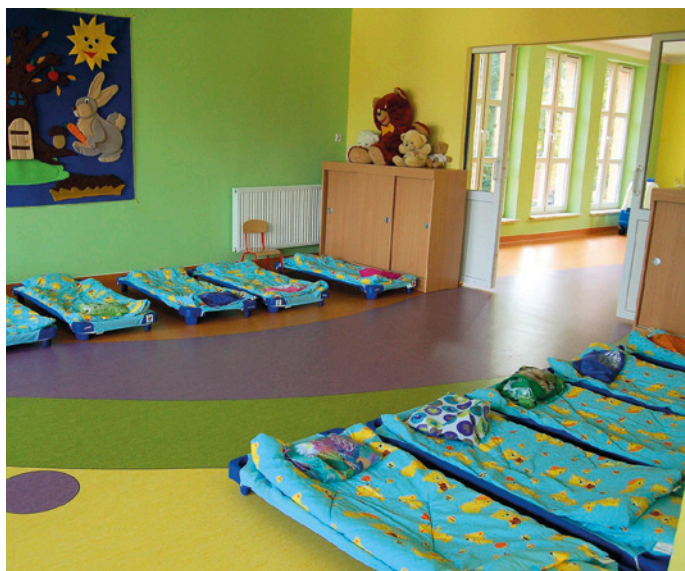
Jedna ze świeżo wyremontowanych sal w żłobku