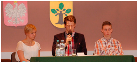
I sesja Młodzieżowej Rady...