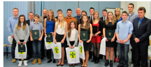
Stypendia i nagrody...