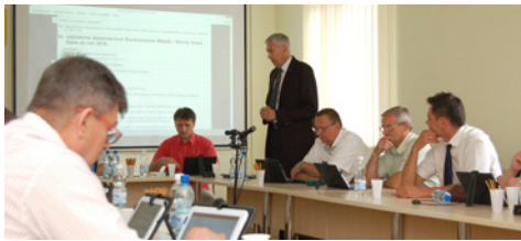
Absolutorium za 2015