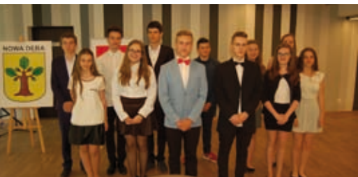
Młodzieżowa Rada II-kadencji